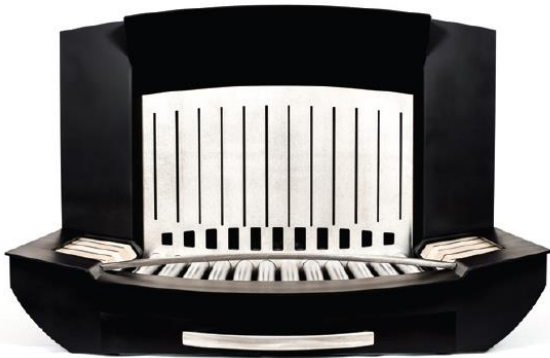
Modèle | M-500