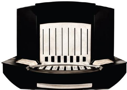
Modèle | M-330